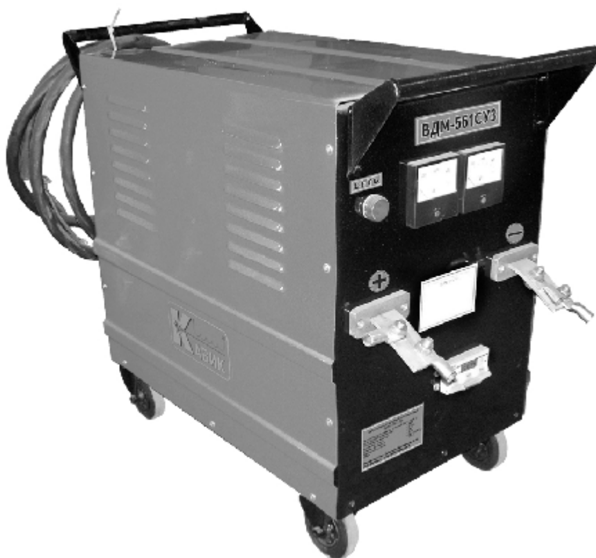
Рис 1. Общий вид выпрямителя

1.4. Не допускается использование выпрямителя для работы в среде насыщенной пылью, во взрывоопасной среде, а также в среде, содержащей едкие пары и газы, разрушающие металлы и изоляцию.